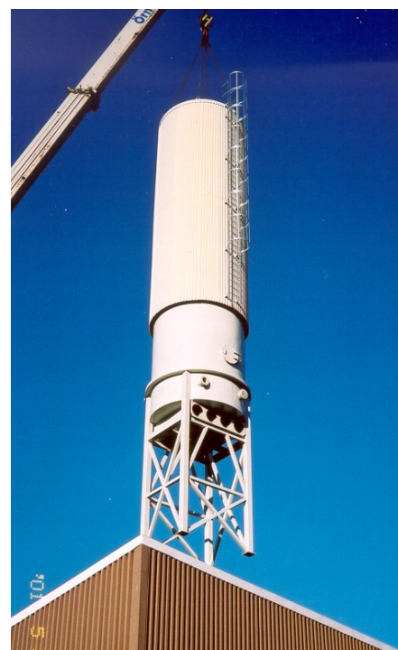
Projekt Göviken i Östersund. Montage av 100 m 3 slamsilo.